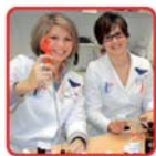
Zubereitung von Naturheilmitteln

Ihr internationales Rathaus-Apotheken Team Kompetent, engagiert, gastfreundlich!