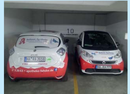
Hier laden zwei unserer Elektrofahrzeuge an unseren eigenen Ladesäulen im Volme Parkhaus.

Für Klimaschutz und Umwelt kann man natürlich noch viel mehr tun als Elektro-Botendienst, wir unterstützen z. B. die Arbeit der Biologischen Station Hagen und pflanzen Schmetterlings-Beete um Lebensräume für Insekten zu schaffen – außerdem haben wir eine Klimaschutzberatung durchführen lassen, über die wir demnächst berichten werden.