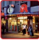
Mehr als 70 Std./Woche geöffnet