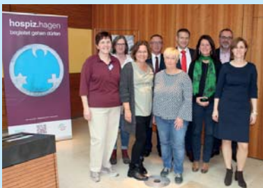
Die Referenten des Hagener Palliativ- und Hospiz-Tages 2017