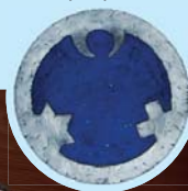
Logo „Engel der Kulturen“