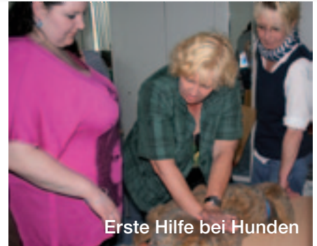
Erste Hilfe bei Hunden

und das gutgelaunte internationale Rathaus-Apotheken Team – kompetent, engagiert, gastfreundlich!