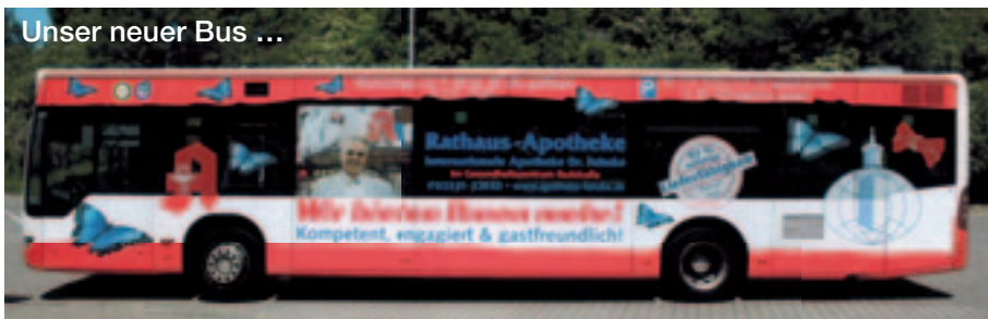
Unser neuer Bus ...