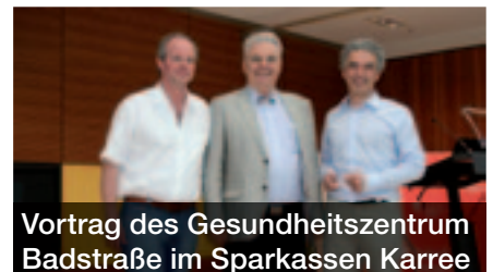
Vortrag des Gesundheitszentrum Badstraße im Sparkassen Karree