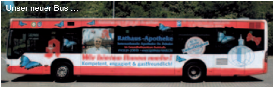
Unser neuer Bus ...

58095 Hagen • Badstr. 4 • Telefon 915980 • Fax 9159821 • E-mail: apotheke@fehske.de • www.apotheke-fehske.de