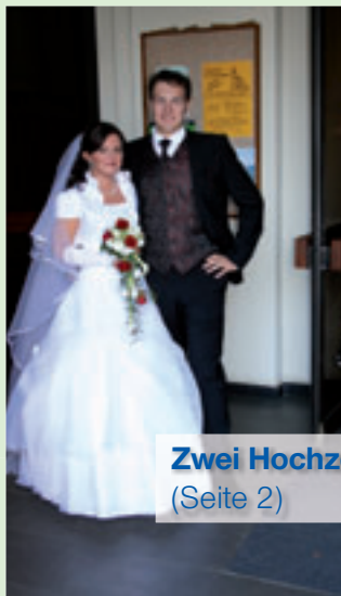
Zwei Hochzeiten – Zwei Babys (Seite 2)

und das internationale Rathaus-Apotheken-Team