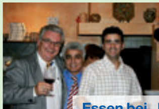
Essen bei „Nico“: Mit den Gewinnern des Mitarbeiter-Ratens (Seite 47)