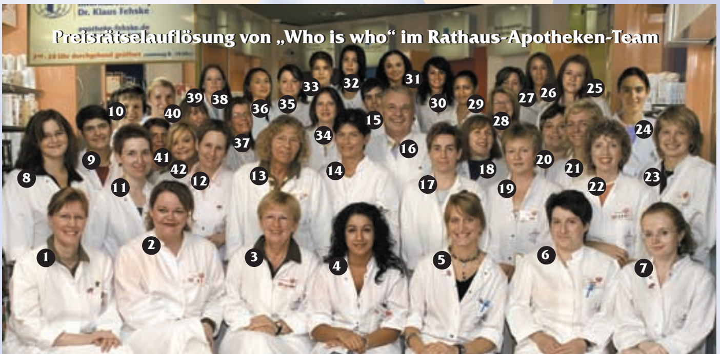
Preisrätselauflösung von „Who is who“ im Rathaus-Apotheken-Team

11 Vor Aufnahme eines intensiven Lauftrainings ist auf alle Fälle eine ärztliche Untersuchung des Herz/Kreislauf-Systems erforderlich – Läufer mit erhöhtem Blutdruck dürfen nur nach ärztlicher Rücksprache laufen.