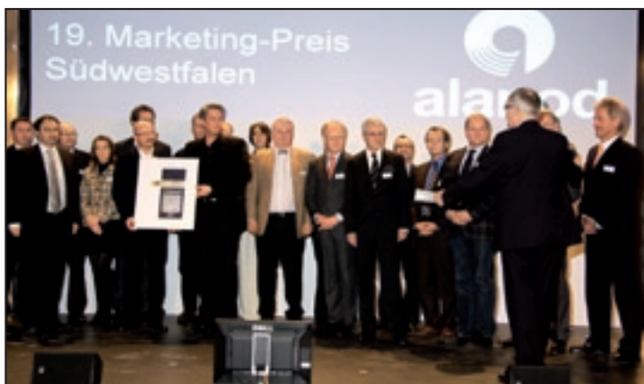
Übergabe des Marketingpreises