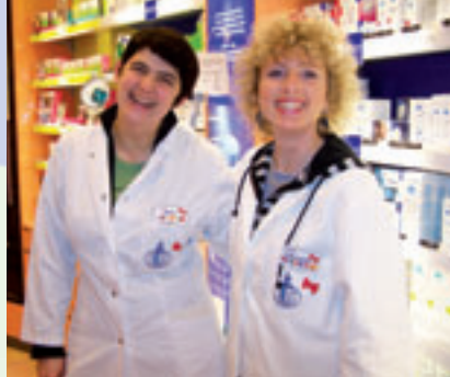
Die Mitarbeiterinnen der Internationalen Apotheke beraten ihre „Gäste“ in 16 Sprachen.