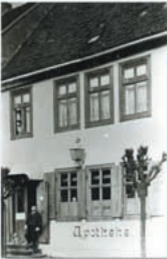
Adler-Apotheke in Grafenhainichen