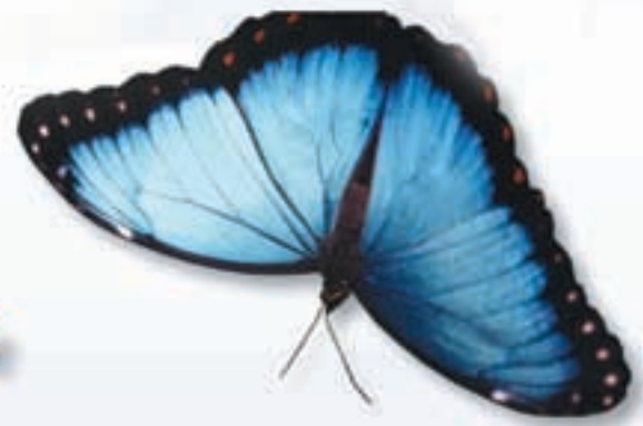
Blauer Morpho aus Costa Rica