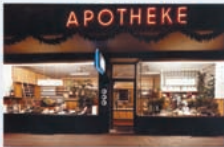
Rathaus-Apotheke bei der Gründung 1957