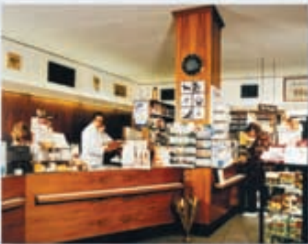
Nach dem ersten Umbau 1968